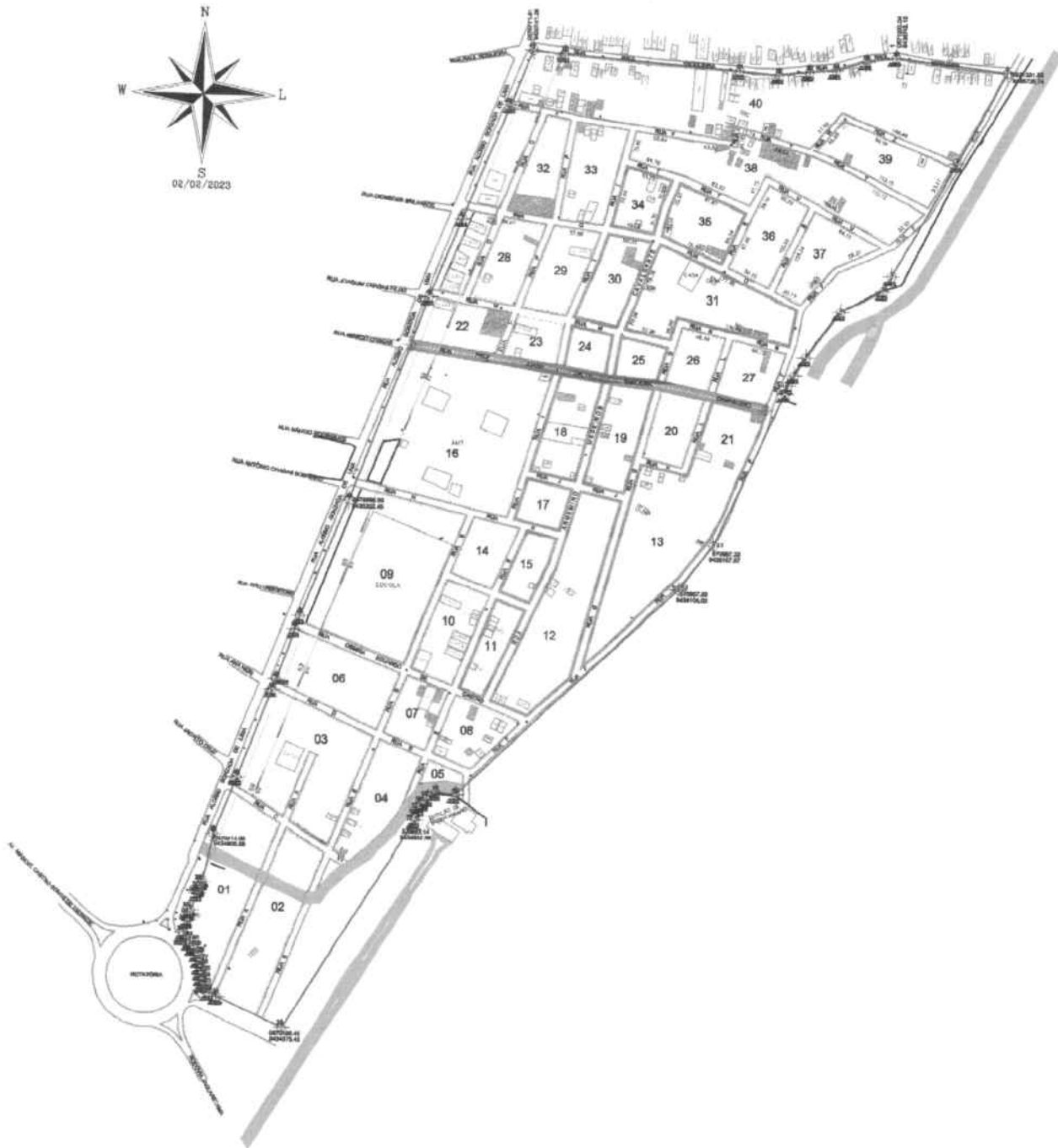
○ PLANTA DE SITUAÇÃO ESC. 1/7500